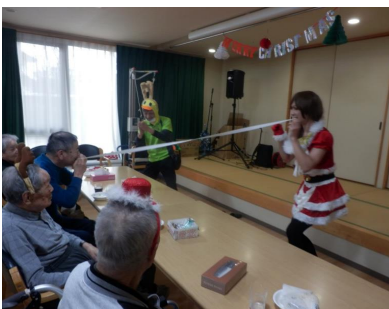
ゴムの両端を咬めてゴムパッチン。利用者さんにもゴムを片方咬えてもらい・・・やっぱりこうなりました。↓