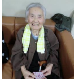
サンタクロース三姉妹。「こんな楽しいのは初めて!」と喜ばれ、また次回のネタを考える活力になりました(笑)